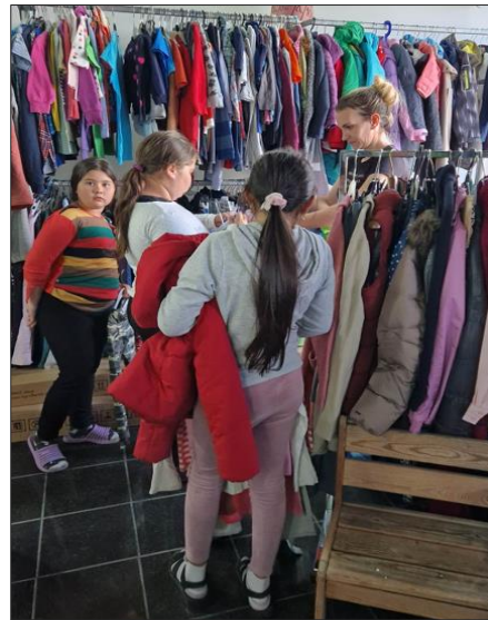
Florina hilft bei der Auswahl der Kleidung